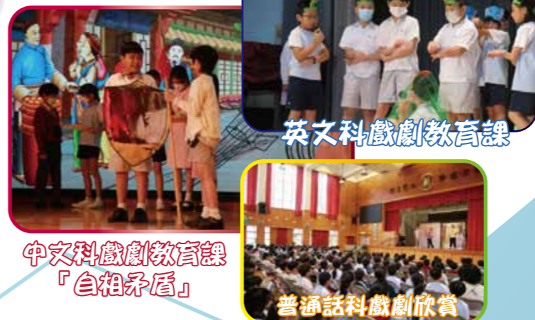
英文科戲劇教育課 中文科戲劇教育課 「自相矛盾」 普通話科戲劇欣賞

本校以多元化的教學策略及學習活動，豐富學生的學習經驗，增加學習趣味，配合閱讀推廣及獎勵計劃，培養學生的共通能力，提升其學習表現。