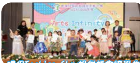
環保Fashion Show提供機會讓學生穿上親子設計的環保服裝走秀