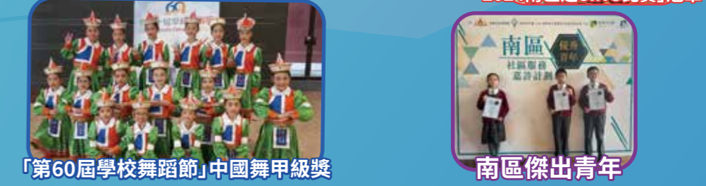
「第60屆學校舞蹈節」中國舞甲級獎 南區傑出青年