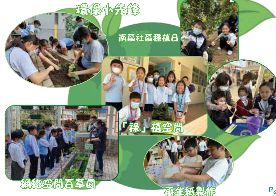
環保小先鋒 南區社區種植日 「綠」植空間 網絡空間百草園 再生紙製作 「小小園藝師」製作自動澆水器

本校透過一系列校本環境教育活動，包括「再生紙製作」、「小小園藝師」、「PETER『換樂』環保市集」，以及參加賽馬會「家校『睇現』可持續發展目標計劃」，培養學生可持續發展生活的概念及對保護環境的知識、技能和正確價值觀。另本校參加機電署及教育局合辦的「綠色校園2.0」計劃，在天台鋪設太陽能光伏板，並成為「採電學舍」，學生能在日常學習中認識再生能源。