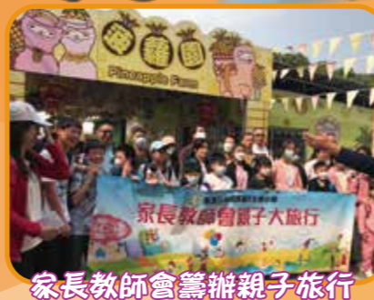
家長教師會籌辦親子旅行