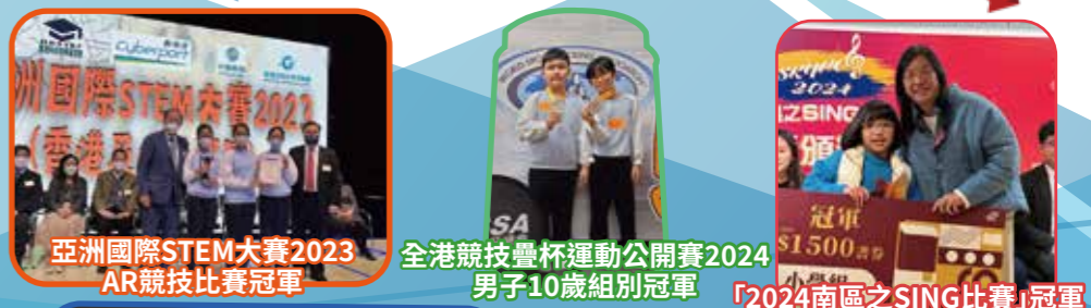
亞洲國際STEM大賽2023 AR競技比賽冠軍 全港競技疊杯運動公開賽2024 男子10歲組別冠軍 「2024南區之SING比賽」冠軍