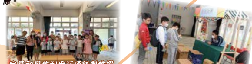
家長和學生利用瓦通紙製作機學習中國傳統榫卯技術。