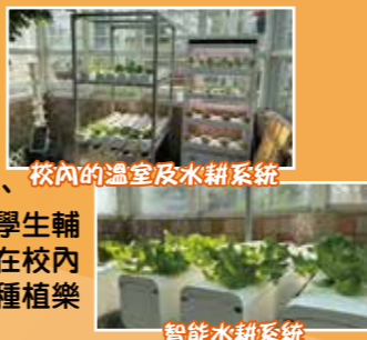
校內的溫室及水耕系統 智能水耕系統

本校校舍樓高七層，除了有三十個課室及四個輔導教學室外，還有兩個籃球場，一個有蓋操場、一個樓高三層的禮堂，一個寬敞的圖書館，並有宗教活動室、多用途活動室、智趣學習室、英語學習中心、電腦室、視藝室、音樂室及學生輔導室。為配合學校發展數碼學習及環境教育的方向，本校在校內溫室設置智能水耕系統，另有供同學進行學習活動及享受種植樂趣的園圃。