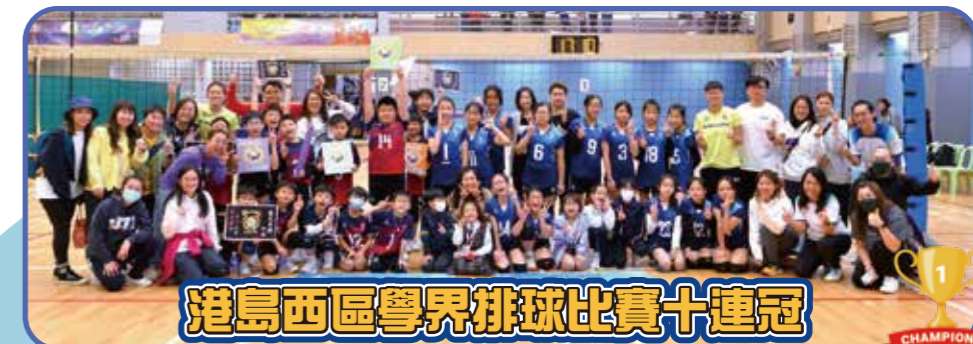
港島西區學界排球比賽十連冠