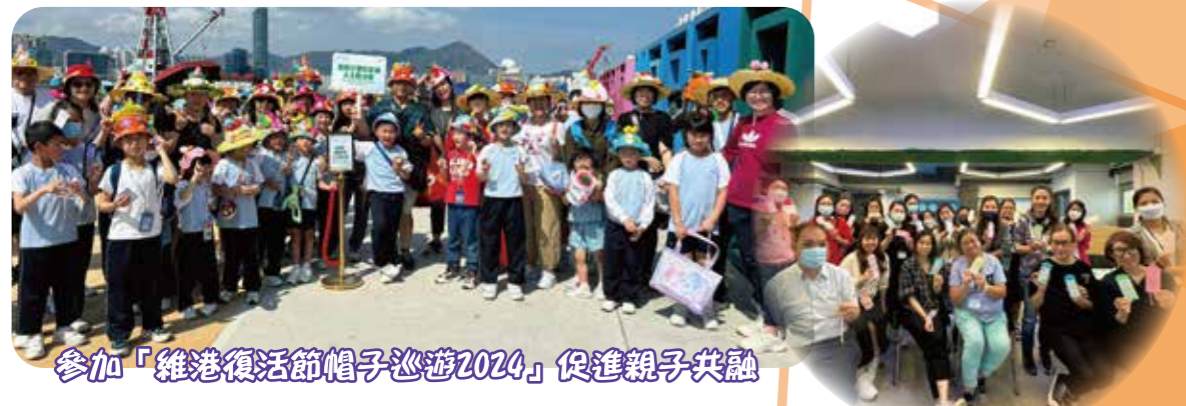
參加「維港復活節帽子巡遊2024」促進親子共融

作為天主教學校，我們致力於在校園中創造仁愛與自由的氛圍，協助學生和家長認識天主。此外，我們深明家長教育對同學學習和成長的重要，故推行「A+家長教育獎勵計劃」，提供更全面的家長培育，幫助家長更好地陪伴和支援孩子成長。透過專業導師主持的家長教育課程和持續的家校合作，為同學創造更好的學習環境，促進學生的全人發展和健康成長。