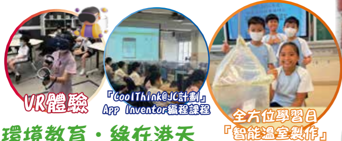
VR體驗 「CoolThink@JC計劃」App Inventor編程課程 全方位學習日 「智能溫室製作」

本校在各學科推展探究體驗式學習，因應學生的學習需要引發他們的好奇心，從而投入學習。在課堂上運用不同層次的提問及高階思維訓練，協助學生掌握知識及建構概念，並為學生提供展示學習成果的機會。另透過創設多元化的學習情境，啟發學生發現事物的關係，引導學生進行學習遷移，促進其自主學習能力的發展。此外，本校安排學生到內地學習和交流，讓其進一步了解祖國歷史、國情及最新發展。