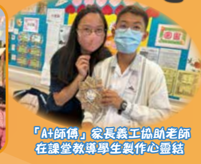
「A+師傅」家長義工協助老師在課堂教導學生製作心靈結