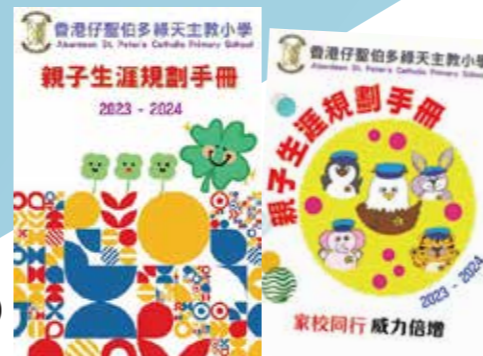
親子生涯規劃手冊協助學生認識自己，確立志向

本校推行校本生涯規劃教育計劃，讓同學認識自己的性向及學習風格，進一步發展潛能。我們以「P.E.T.E.R.」(Positive 正面積極、Excellent 追求卓越、Tough 堅強勇毅、Energetic 充滿活力和Reflective勇於自省)理念，推行「港天之星」教育計劃，並設計「親子生涯規劃手冊」，讓家長和子女一起商討同學的人生目標，並訂定實踐目標的計劃，協助孩子立足現在，放眼未來，將來可成為地盤世光，光榮天主。