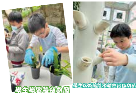
學生學習種植國蘭 學生以太陽能水耕柱培植幼苗

本校推行「藝聚港天 Arts Infinity」校本輔導計劃，以「正向心理」為主軸，透過藝術創作，結合中華文化、科學與科技、環境教育和國民教育，讓學生認識社區，培養正確價值觀，並滙聚學生的創意，製作實用裝飾品，使校園成為充滿藝術氛圍和文化活力的地方。另鼓勵學生積極參與社區服務，建立共融成長文化，促進社區的可持續發展。另本校引導學生懂得以智慧管理大地，以班本的實踐活動進行正向價值教育，讓全體學生透過照顧觀葉植物來體驗生命的奇妙之處，培養尊重自然、負責任、感恩和關愛的態度，並同時創造綠化空間以促進學生的精神健康。