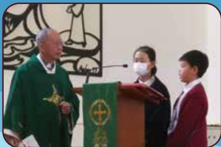
學生出席聖伯多祿堂主日感恩祭

本校重視學生的信仰培育及正確價值觀的培養，配合校本學習主題安排多元化活動促進學生的家庭共融，並讓學生體會到愛社區、愛香港和愛國家的重要，培養學生積極的人生觀，引導他們發揚校訓「敬主愛人·修德力學」的精神，掌握成聖人生的「鑰匙」，以成為「伯多祿傳人」為目標。