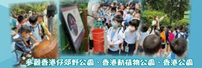
參觀香港仔郊野公園、香港動植物公園、香港公園

本校配合環境教育推行跨科學習，讓學生透過校內、外的觀察、探究活動建構新知識及擴闊視野，從「學」到「思」，體會人與大自然的緊密關係，愛護環境，實踐低碳生活，成為地球好管家。