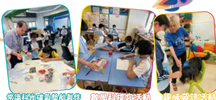
常識科光碟氣墊船製作 數學科探究活動 趣味英語活動